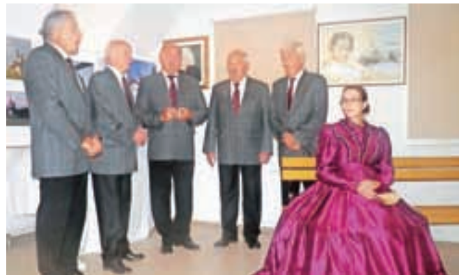
Bogat kulturni program je sooblikoval Kranjski kvintet.