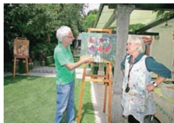
Zakonca Mauser sta pripravila vse za slikarsko delavnico v senci Graščine Duplje. En dan prej pa skupaj naslikala sliko (na fotografiji).

Celodnevna prireditev Na vasi se dogaja, letos že tretjič in lahko rečemo, da že tradicionalna, je bila ob občinskem prazniku v soboto, 21. junija. Tudi obiskovalcev je bilo tradicionalno veliko, nekateri so se od Naklega, Dupelja do Podbrezja in nazaj popeljali s panoramskim avtobusom, spet drugi so kolesarili ... Če strnemo: za vsakega se je kaj našlo.