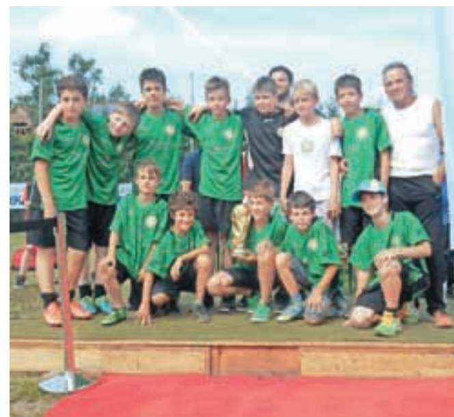
Mladi nogometaši so iz Ebenthala odnesli zmagovalni pokal.

neodločenim izidom. V tretji tekmi so se izkazali in samo v nekaj minutah kar trikrat zatresli mrežo celovške ekipe SV Donau, kar je zadostovalo za skupno turnirsko zmago. Veselje naklanskih nogometašev po napornem turnirju je bilo nepopisno, turnir v sosednji Avstriji pa je lahko dober zgled za organizacijo podobnih medsosedskih nogometnih srečanj.