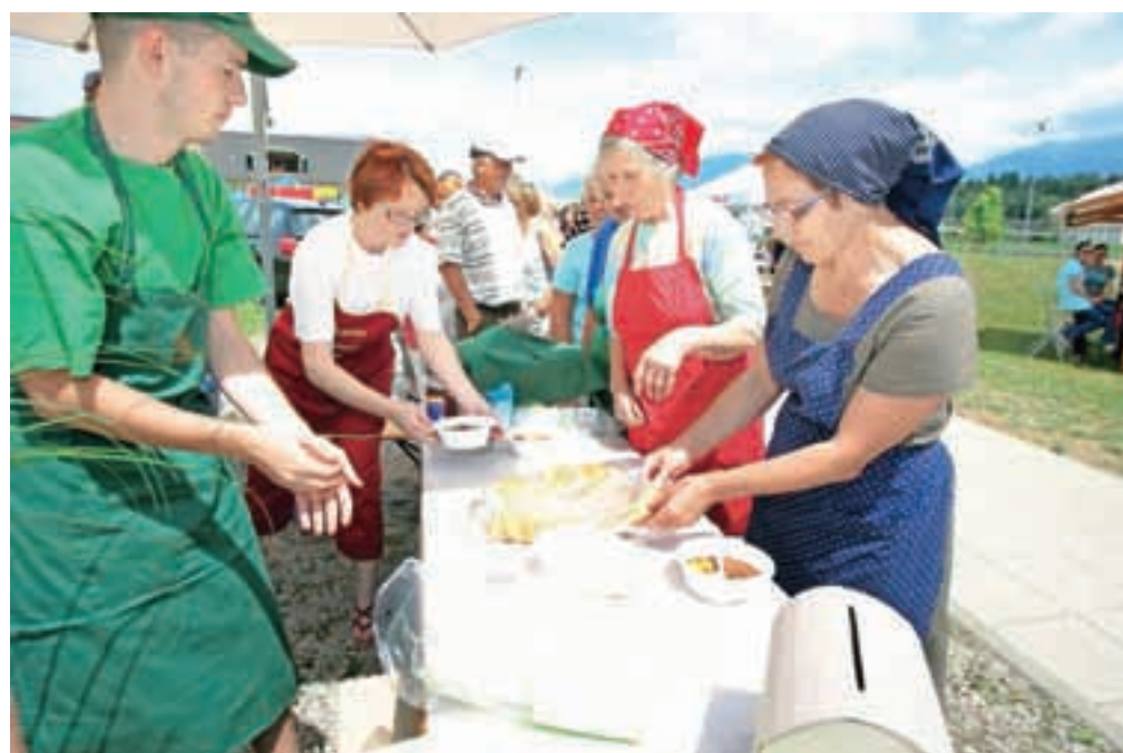
Vaški lovski golaž je skuhala in postregla Lovska družina Udinboršt.