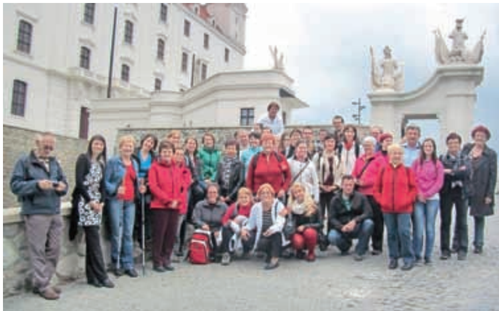
Dupljanske pevke in njihovi navijači na bratislavskem gradu

času treba videti na Dunaju: opero, mestno hišo, parlament, rezidenco predsednika republike, restavracijo Saher in tudi grobnico dru-