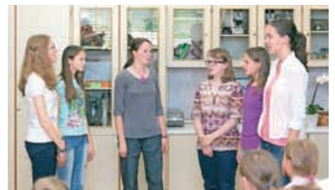
Ljudske pevke OFS Podkuca razveseljujejo z ubranim petjem na številnih prireditvah.