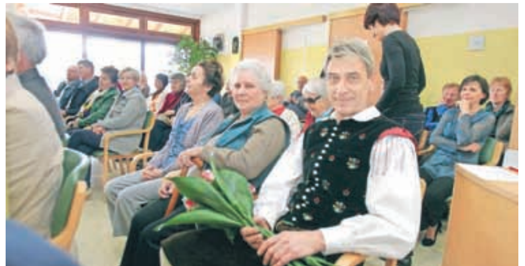
Prijetno vzdušje ob praznovanju mini jubileja.

maja 2009 so sprejeli prve stanovalce in dom je bil 29. maja s 46 stanovalci že polno zaseden. Sodelovanje med občino in domom je ves čas zgledno.