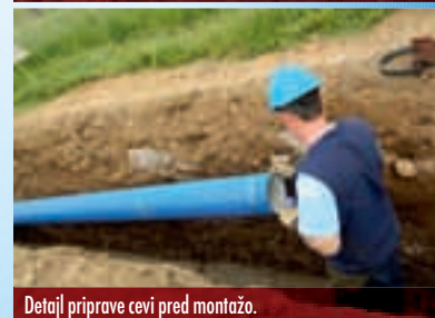
Detalji priprave cevi pred montažo.