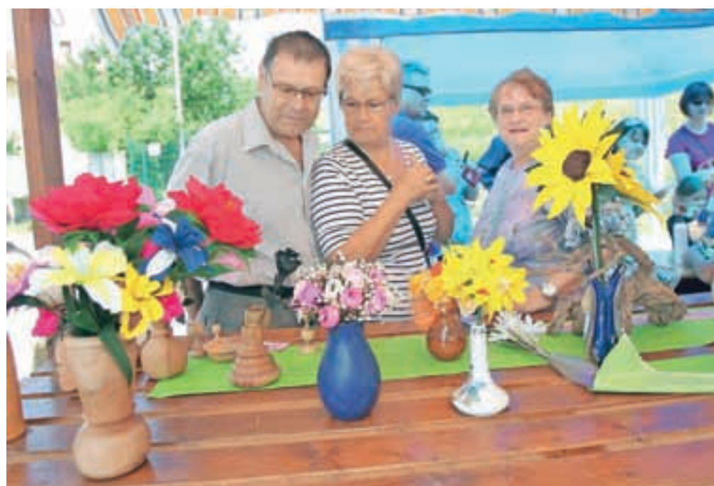
Članice in en član skupine Spominčice iz Naklega znajo klekljati, pred časom pa so osvojili tudi znanje izdelovanja cvetja iz krep papirja.