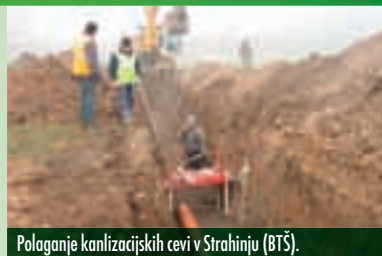
Polaganje kanalizacijskih cevi v Strahinju (BTŠ).

V prihodnjih mesecih bomo z deli seveda nadaljevali, zaradi česar bo še naprej prihajalo do zaprtij posameznih lokalnih cest, o čemer vas bomo redno obveščali. Ob tej priložnosti bi se vam želeli iskreno zahvaliti za doslej izkazano potrpežljivost, dobro sodelovanje in razumevanje. Prav zaradi vaše dobre volje nam uspeva projekt brez večjih pretresov peljati po zastavljeni poti.