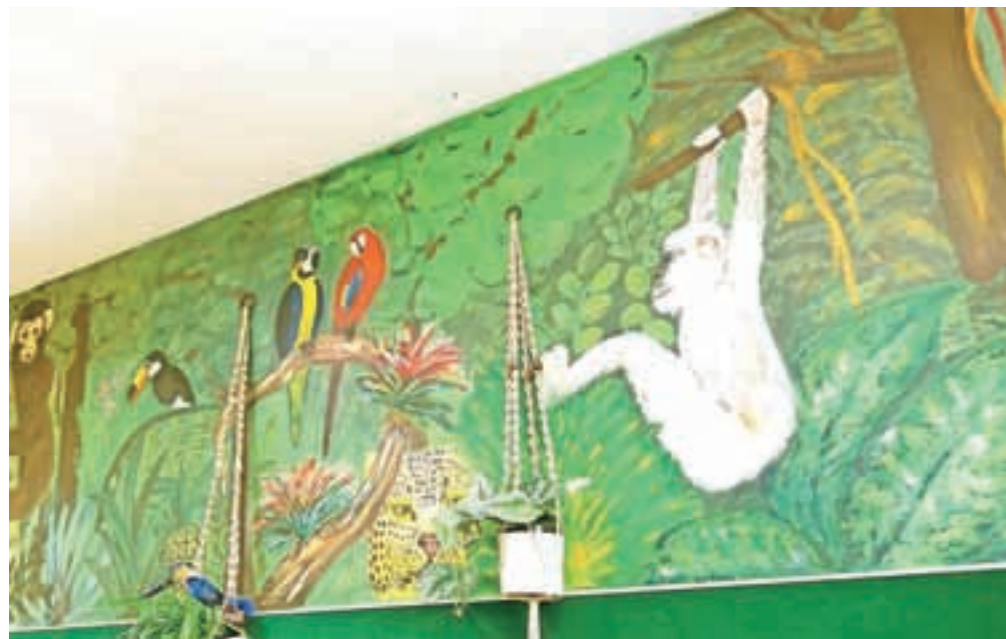
Izvirna stenska poslikava v biološki učilnici