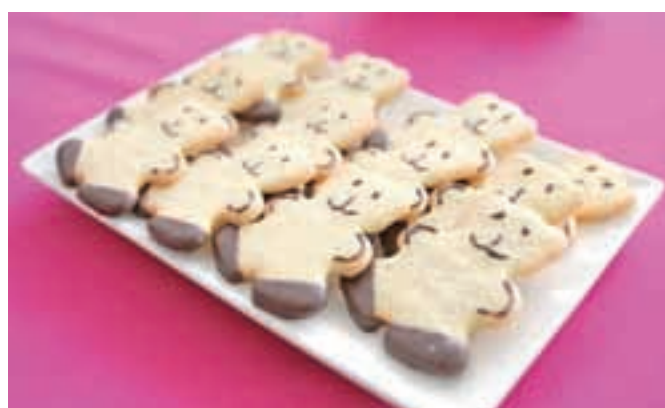
Ko ima človek poklic in zna opraviti neko delo, nastanejo tudi okusni piškoti.