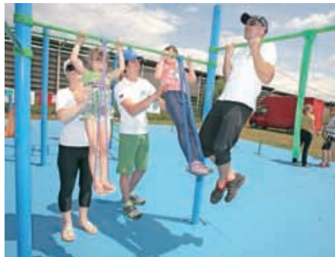
Šeststo kvadratnih metrov vadbene površine na prostem

pa 2014–2020, ki ji zvesto sledi tudi program EU Erasmus, hoče Evropska unija razviti pametno, trajnostno in vključujoče gospodarstvo, ki bi vsem omogočalo napredek. Temelj za to je zdravje evropskih državljanov. Le zdravi ljudje lahko kot aktivno prebivalstvo povečujejo produktivnost in konkurenčnost gospodarstva.« Zdravje pa pomeni tudi redno telesno aktivnost