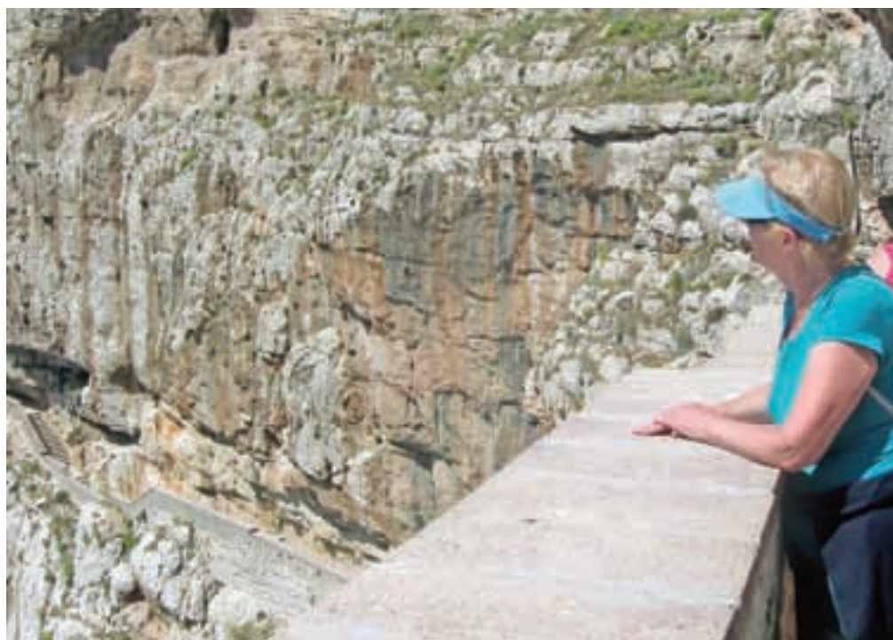
Stopnišče, ki vodi v Neptunovo jamo.

In že smo prispeli na polotok Sinis, po katerem smo se popeljali z vlakcem, izstopili smo pred vhodom v ostanke nekoč cvetočega pristaniškega in trgovskega mesta Tharros. Mesto so v 8 st. pr. n. št. zgradili Feničani, največji razcvet pa je doživelo pod Rimljani. Imelo je vodovod in kanalizacijo, ceste, ki so še danes v dobrem stanju, terme, tem-