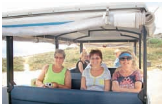
Na izlet bodo ostali lepi spomini.

Ostala nam je samo še pot do pristanišča Olbia. Spotoma smo se ustavili v piceriji Porta Smeralda, kjer smo imeli zadnje skupno kosilo. Zvečer smo se spet vkrkali na trajekt in odpluli proti domu. Veliko lepega smo videli, veliko zanimivega izvedeli, udobno in varno smo se vozili, na Sardinijo nam bo ostal lep spomin.