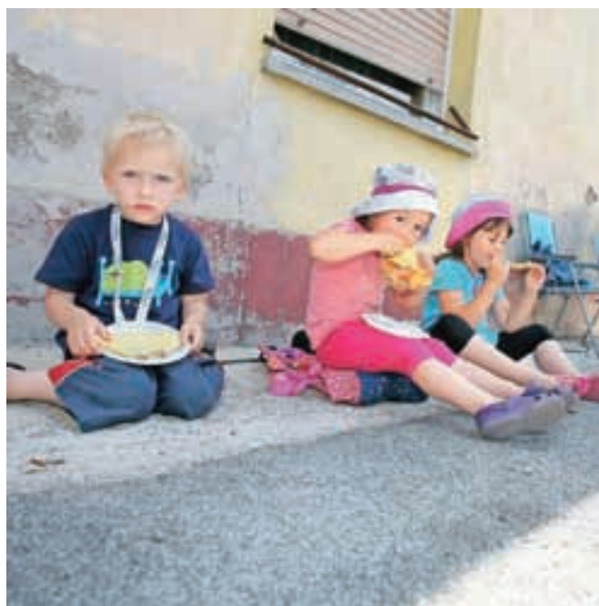
Palačinke so bile okusne, ni kaj dodati temu ... Posnetek je iz Dupelja.