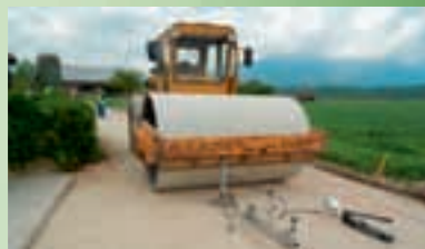
Zaključna dela: meritve podlage pred polaganjem asfalta.